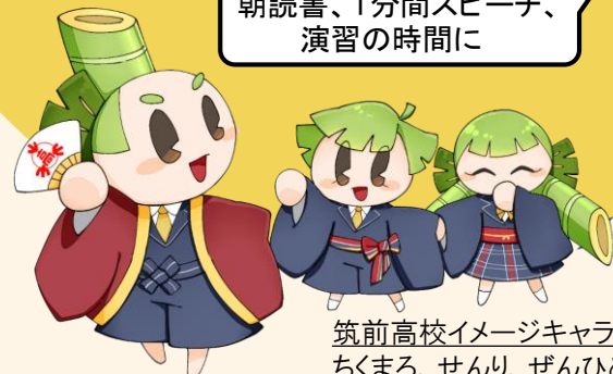
筑前高校イメージキャラクター ちくまる、せんり、ぜんひめ