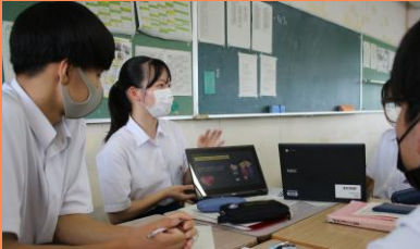
【3年生】 個別探究活動プレゼン練習