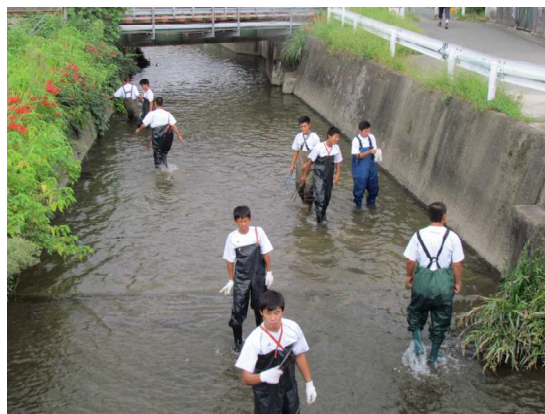
〔地域ボランティア〕