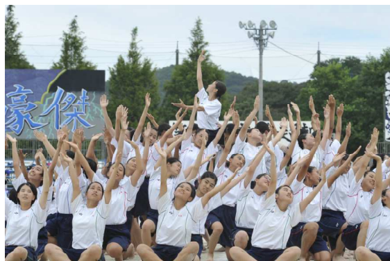
〔体育祭、創作ダンス〕