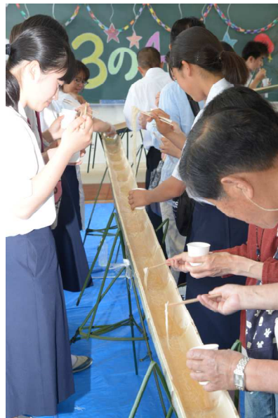
〔筑前祭、クラス企画〕