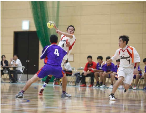
〔ハンドボール部 (男子)〕