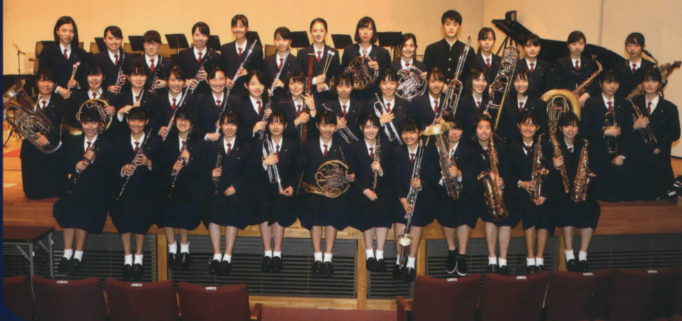
筑前高等学校吹奏楽部