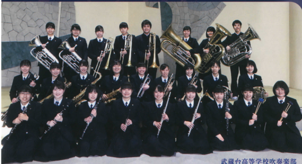
武蔵台高等学校吹奏楽部